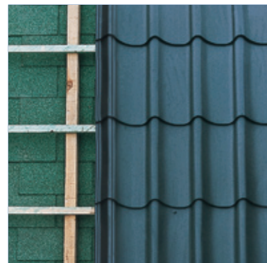
Renovatie op gebitumeerde ondergrond

Bij singel- en bitumdaken kan de dak-op-dak-methode toegepast worden.